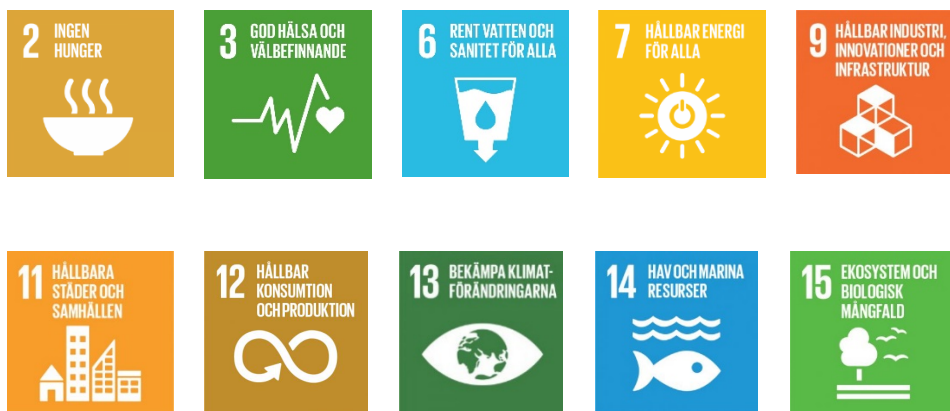
Bild. Exempel på globala mål som vägleder analys och sårbarheter i klimatanpassningsarbetet

Utgångspunkten för kommunens arbete med klimatanpassning är de globala hållbarhetsmålen Agenda 2030 3 .