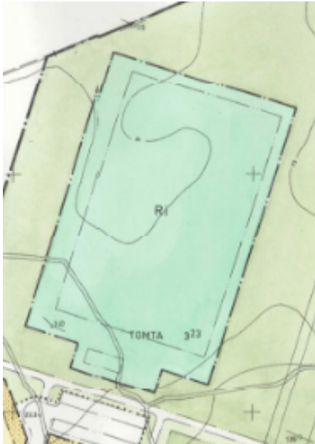
Bild 4 Detaljplan Mullevallen