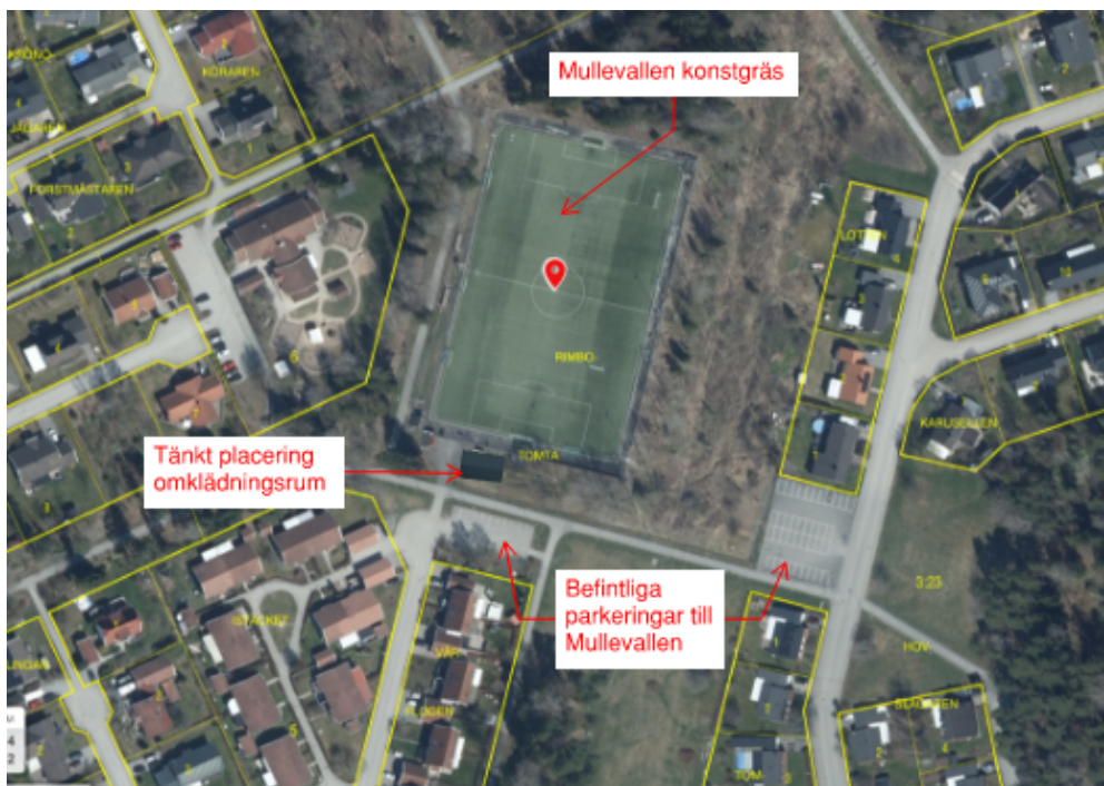
Bild 5 Översikt Mullevallen