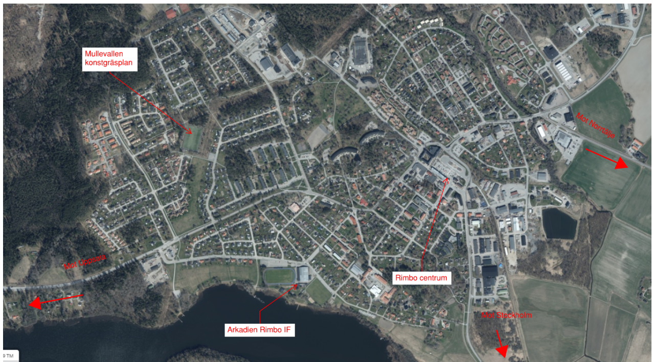
Bild 1 Översikt Rimbo

Mullevallen är en fullstor konstgräsplan med läktare, avbytarbås och liten kiosk. År 2023 lades nytt konstgräs på Mullevallen.