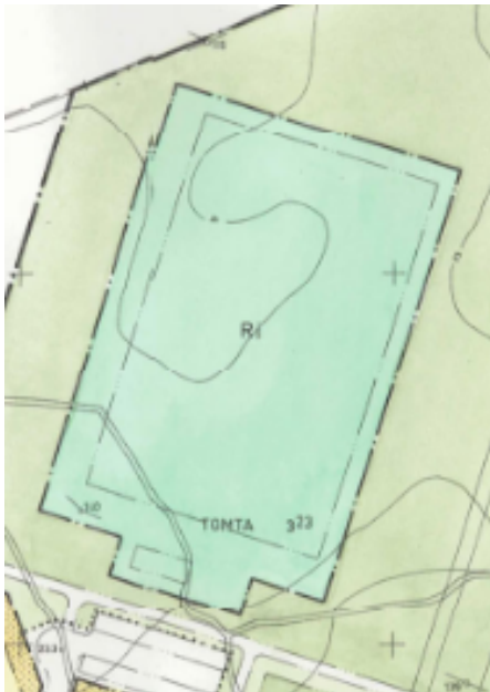
Bild 4 Detaljplan Mullevallen