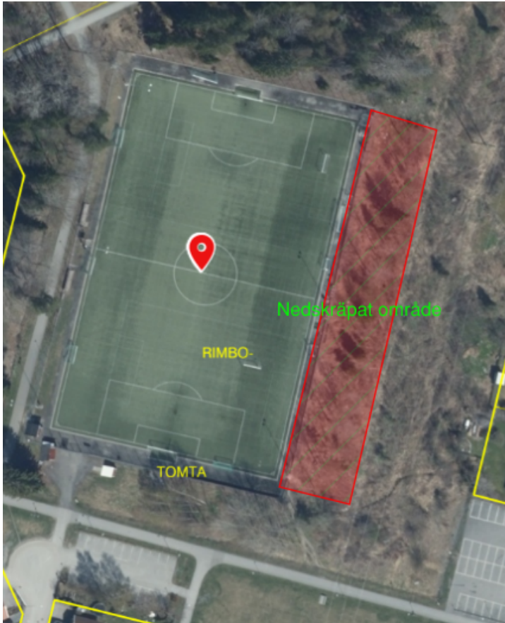
Bild 3 Nedskräpat område