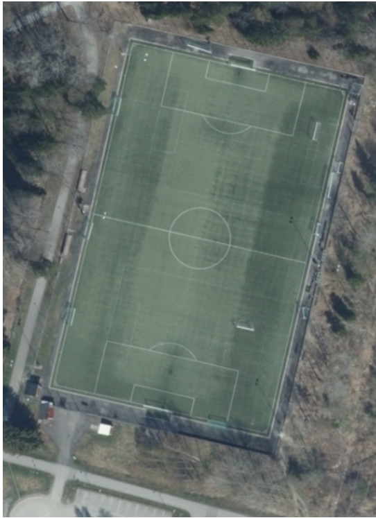
Bild 2 Mullevallens konstgräsplan