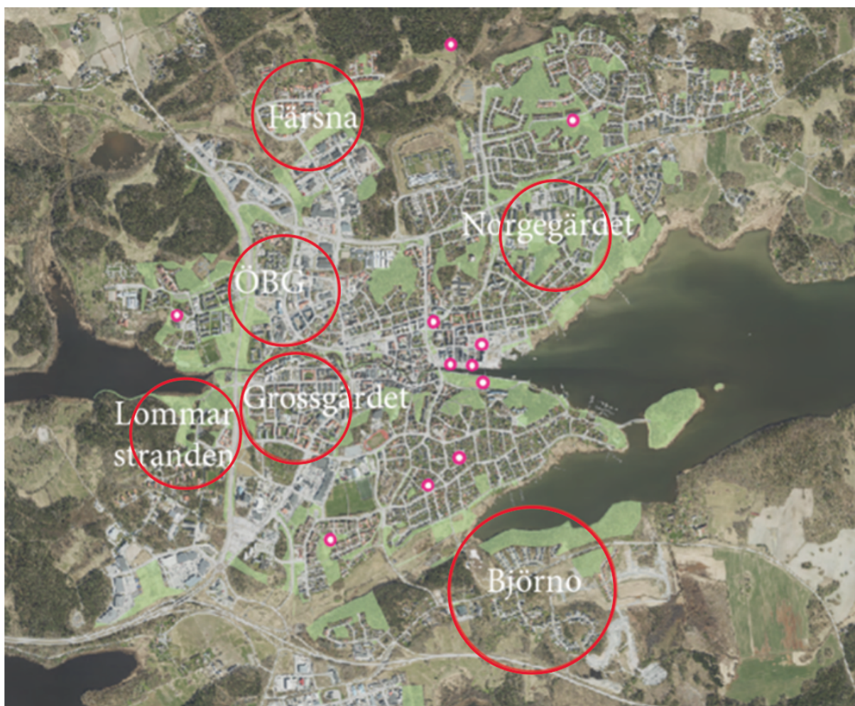
Figure 4 kartbild som pekar ut områden där det idag saknas befintliga lekplatser på stadsdelsnivå, röda ringar. Rosa prickar visar befintliga lekplatser. Gröna områden är mark som är planlagd som park eller natur.