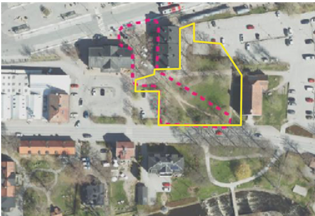
Figure 2 flygfoto över plats med potential – stråk öster om busstationen som visas med rosa streckad linje. Gul linje visar område som är detaljplanlagt som park.