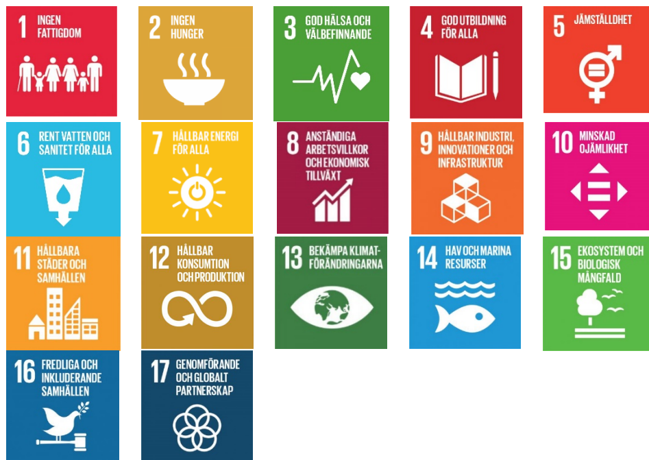
Bild. Globala hållbarhetsmål som direkt eller indirekt inkluderas i klimatarbetet.

Utgångspunkten för kommunens arbete med klimathandlingsplanen är de globala hållbarhetsmålen Agenda 2030.