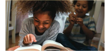
BETÄNKANDE AV UTREDNINGEN OM FRITIDSHEM OCH PEDAGOGISK OMSORG