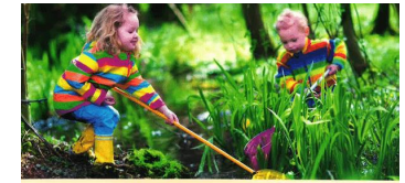
Stärkt kvalitet och likvärdighet i fritidshem och pedagogisk omsorg