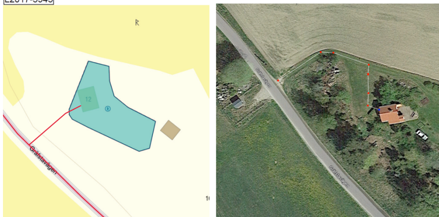
Karta med ursprunglig planerat schakt(vänster) och ortofoto med justerad gällande sträckning (höger).