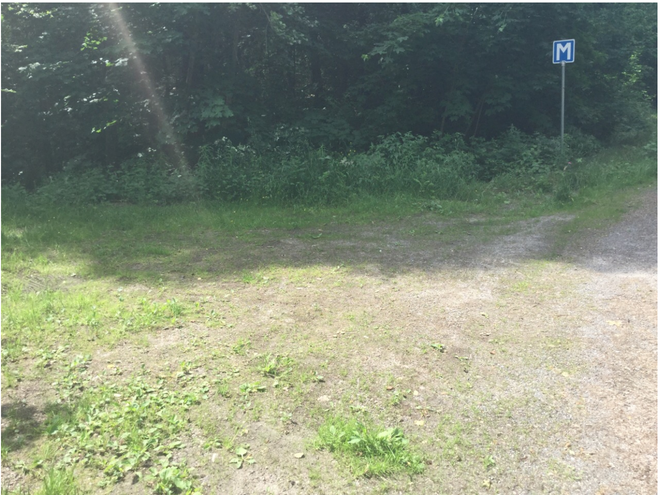
Bilaga 3. Fotografi på den plats där mötes- och parkeringsplatsen avses utökas