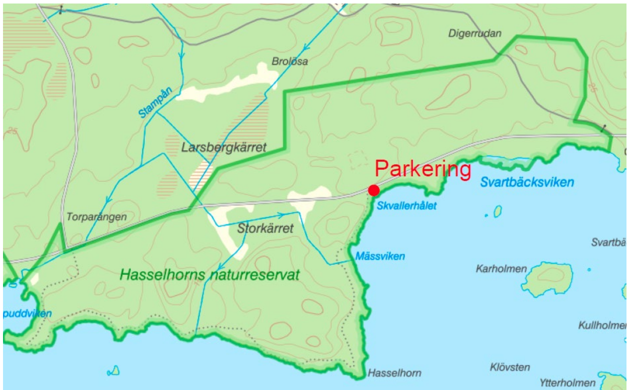
Bilaga 1. Karta över reservatet samt parkeringsplatsens placering