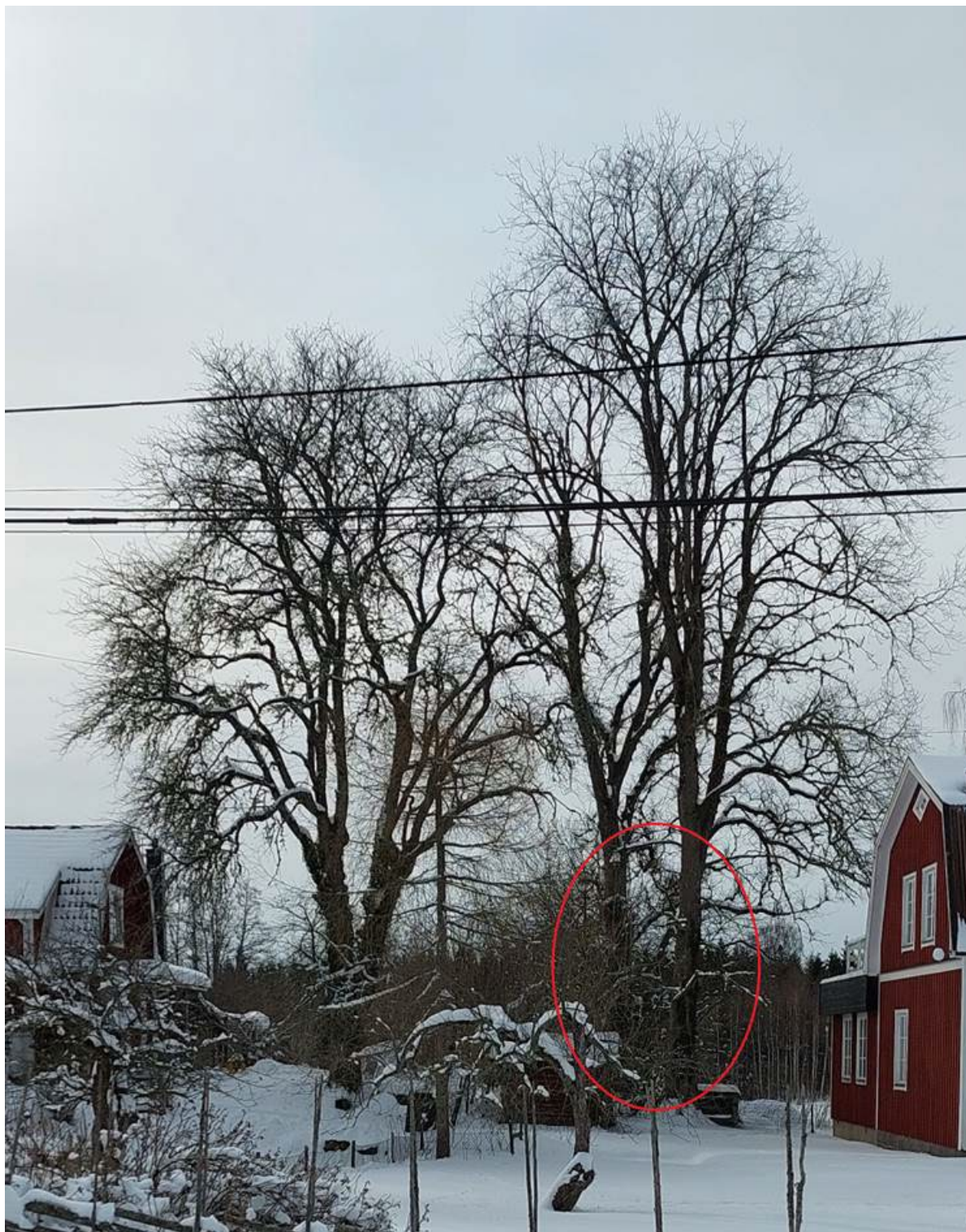
Fotografi med de två almarna markerade med röd ring