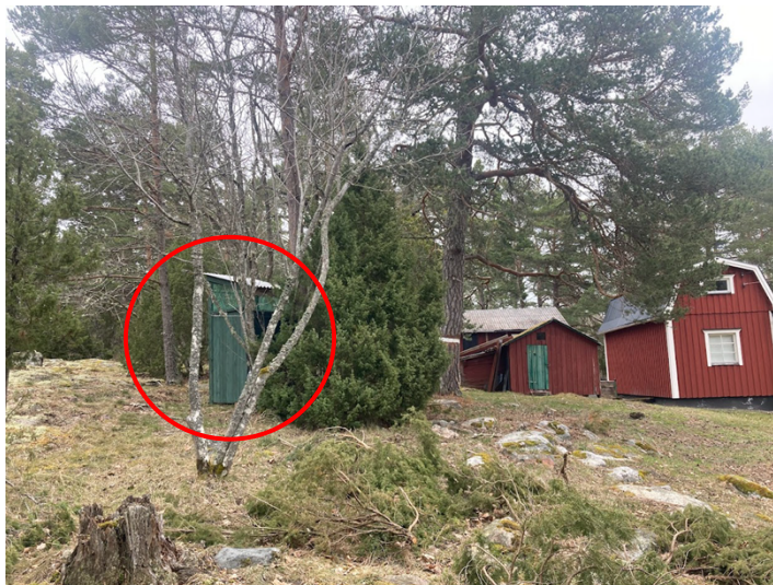
Figur 1. Uteduschen till vänster, reservatsgräns i mitten och byggnader på fastigheten Strömdalen 1:2. Fotot är taget mot nordost längs med reservatsgränsen.

Genom ett tips kom det till Länsstyrelsens kännedom att en utedusch inom Prästskatens naturreservat på fastigheten på fastigheten Häverö-Norrby 6:4 i Norrtälje kommun, se figur 1-2. Det aktuella området omfattas även av strandskydd om 100 m från Verksundet.