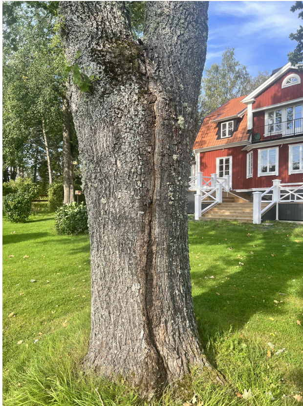
Figur 1. Aktuell ek

Anmälan avser avverkning av en ek som står nära intill ett bostadshus på den aktuella fastigheten, se figur 2. Det framgår inte av anmälan hur grov ekens stam är, men anmälaren har bedömt att den aktuella eken är en särskilt skyddsvärd ek. Eken är inte medtagen i Länsstyrelsens inventering av skyddsvärda träd.