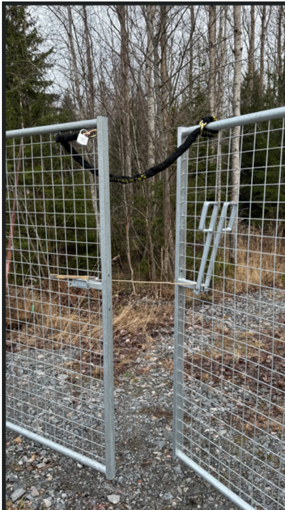
Figur 2. Bild på en av de åtgärdade grindarna.

Den 27 januari inkom fastighetsägaren med fotografier som visar att grindarna nu går att öppna och stänga, se figur 2.