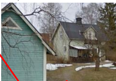
5127, Härden 1