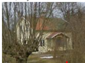
5166, Tälje 2:101