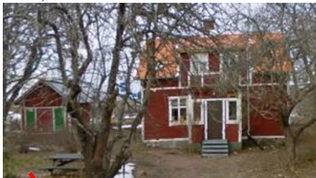
5125, Hemmet 9