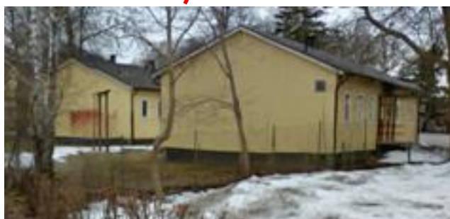
Brännasskolan 2 st baracker