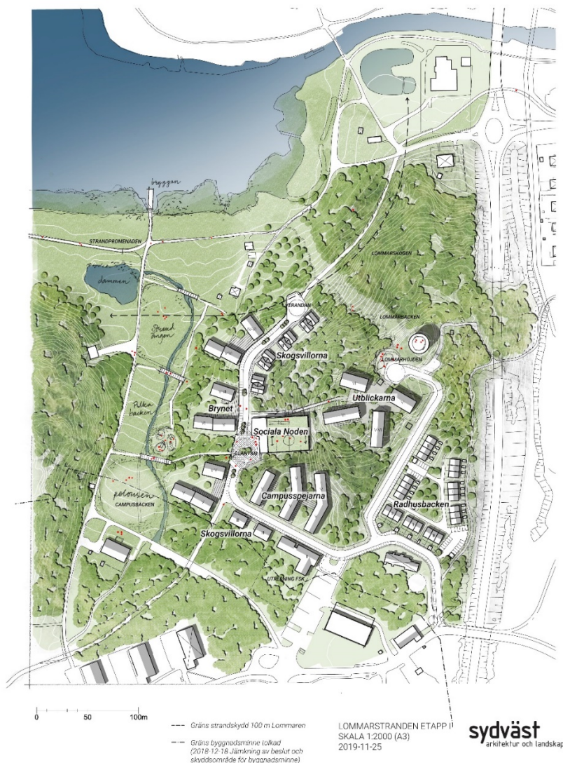
BILD 1: Masterplan för Lommarstranden Etapp I, dat. 2019-11-25, bilaga 16.

Området är uppdelat i 11 stycken kvarter (10 med bostäder och 1 med parkeringsanläggning), varav kvarter nr 10 bevaras i kommunens ägo tills vidare då det i framtiden finns möjlighet att utveckla en förskola på kvarteret alternativt ytterligare bostäder. Kvarter 10 är därför i detaljplanen planlagd både som förskola och bostäder då behovet av en förskola på platsen inte är säkerställd men har varit under diskussion. Möjlighet och förväntningen är att kvarter 10 i framtiden kommer säljas med antingen ändamålet för en förskola eller för ytterligare bostäder. För de övriga kvarteren, kvarter 1-9 samt kvarteret "Noden", har det tecknats ett marköverlåtelseavtal för respektive kvartersindelning med respektive part som redovisas i bilden nedan. Kvarteret "Noden" kommer att överlåtas till den samfällighetsförening som förvaltar gemensamhetsanläggningen, med exploatörerna som andelsägare. Detta i enlighet med (nya) samverkansavtalet som tecknas för Noden. Ansökan om lantmäteriförrättning är inlämnad och kommer att påbörjas när detaljplanen har vunnit laga kraft. Gemensamhetsanläggningen för Noden samt samfällighetsföreningen bildas i samband med lantmäteriförrättning. Marköverlåtelseavtalet för kvarteret "Noden" undertecknas i samband med att lantmäteriförrättningen avslutas.