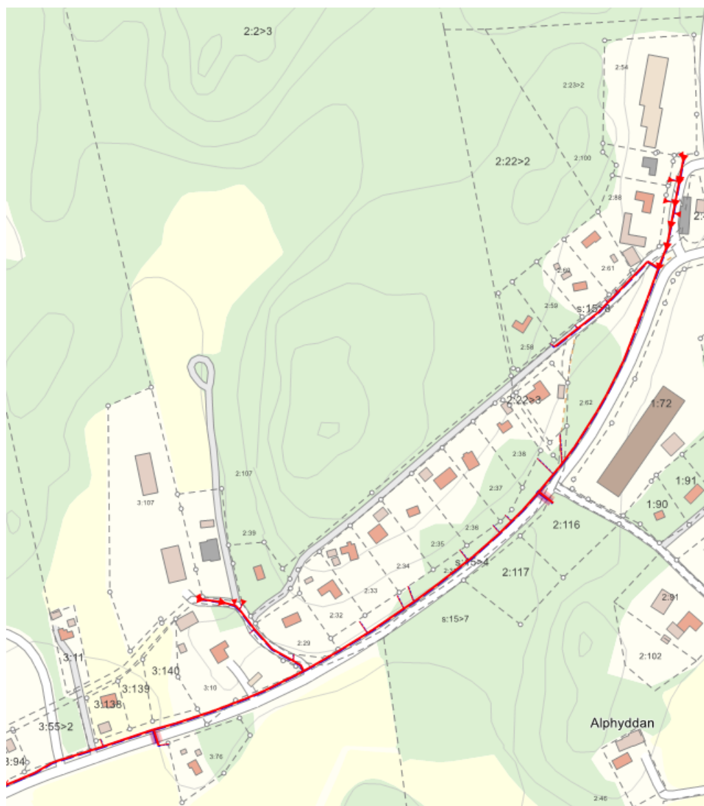
Bild 1. Översiktsbild Bergshamra centralt

Nyttjanderättsavtal har tecknats med 7 st fastighetsägare och ansökan om ledningsrätt har skett. Handläggning av ärendet har påbörjats hos Lantmäteriet.