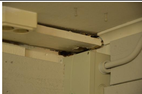
Figur 4 Bilden visar ett exempel på håligheter i taket