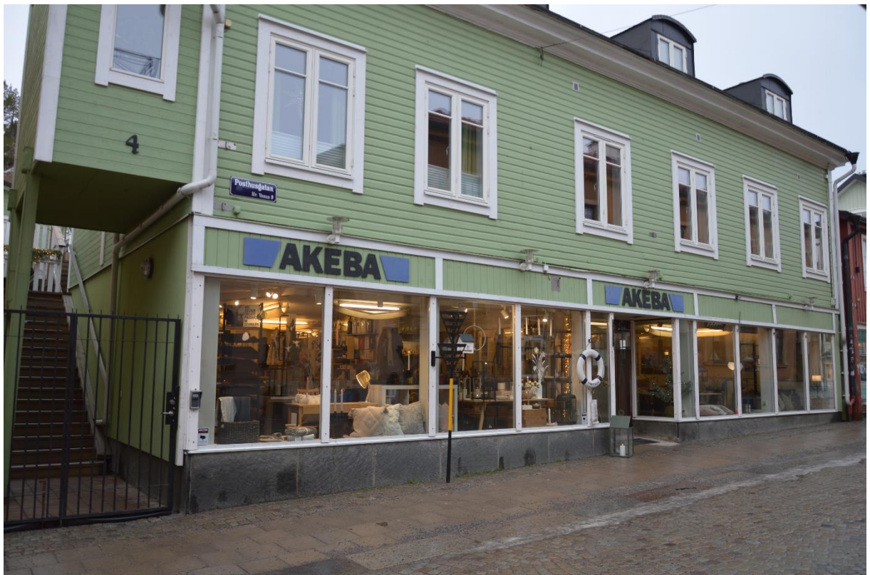
Figur 1 Bilden visar AKEBAS fasad som vetter mot Posthusgatan.

Byggnaden är att betrakta som byggnadsklass Br1 enligt boverkets byggregler, BFS 1993:57.