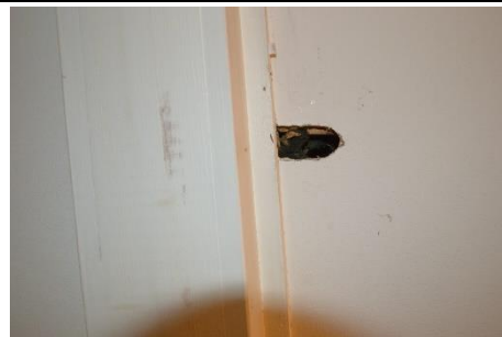
Figur 5 Bilden visar ett exempel på håligheter i taket