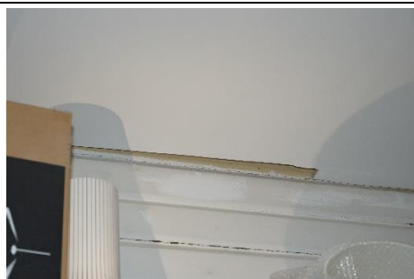
Figur 2 Bilden visar ett exempel på håligheter i taket

Motiv: Otätheter medför värmespridning och risk för att gnistor och eller lågor tar sig in i mellanbjälklagets bärande konstruktion i händelse av brand i butiken.