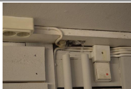
Figur 3 Bilden visar ett exempel på håligheter i taket