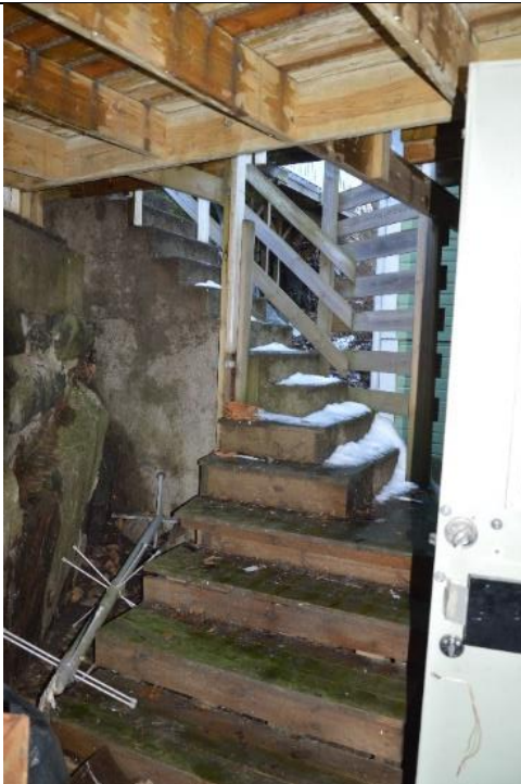
Figur 7 Bilden visar delvis snöbelagd trapp vid befintlig utrymningsväg

Flytt av alternativ utrymningsväg betryggar vidare förflyttning utanför byggnaden till säkrare plats.