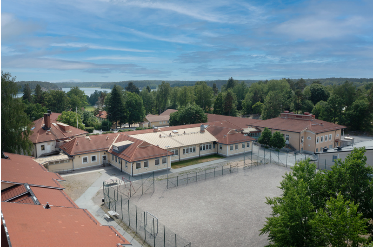
Bild 1 Läna skola