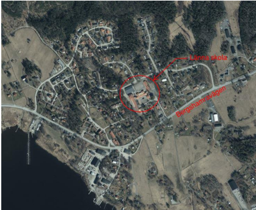
Bild: Karta Bergshamra och Läna skola