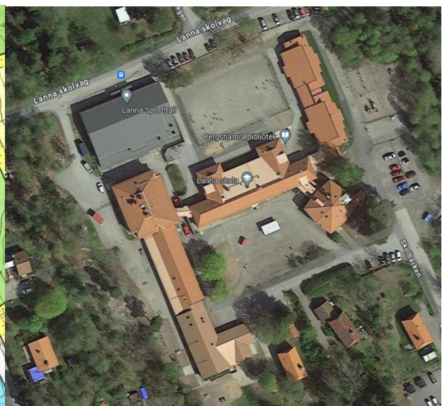
Bild 3 Flygfoto Länna skola