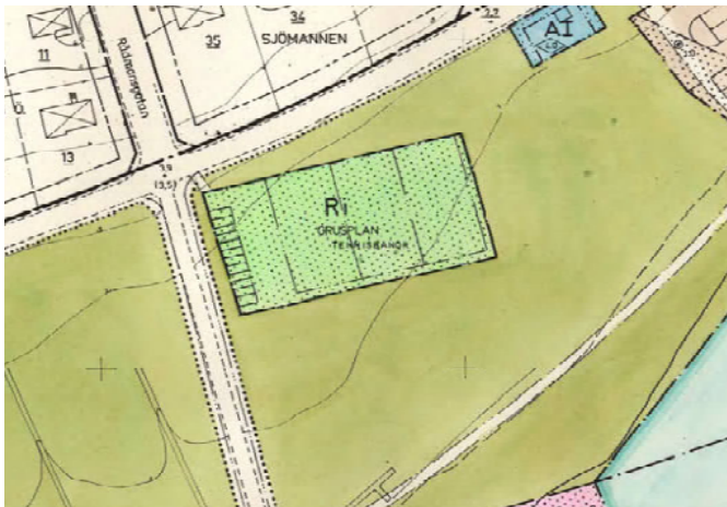
Utdrag ur plankarta, stadsplan för Inre delen av Kvisthamraviken, år 1980

Tidsbegränsat bygglov för ställplatser bedöms kunna beviljas. Tidsbegränsat bygglov får ges för en sammanlagd tid på högst 15 år.