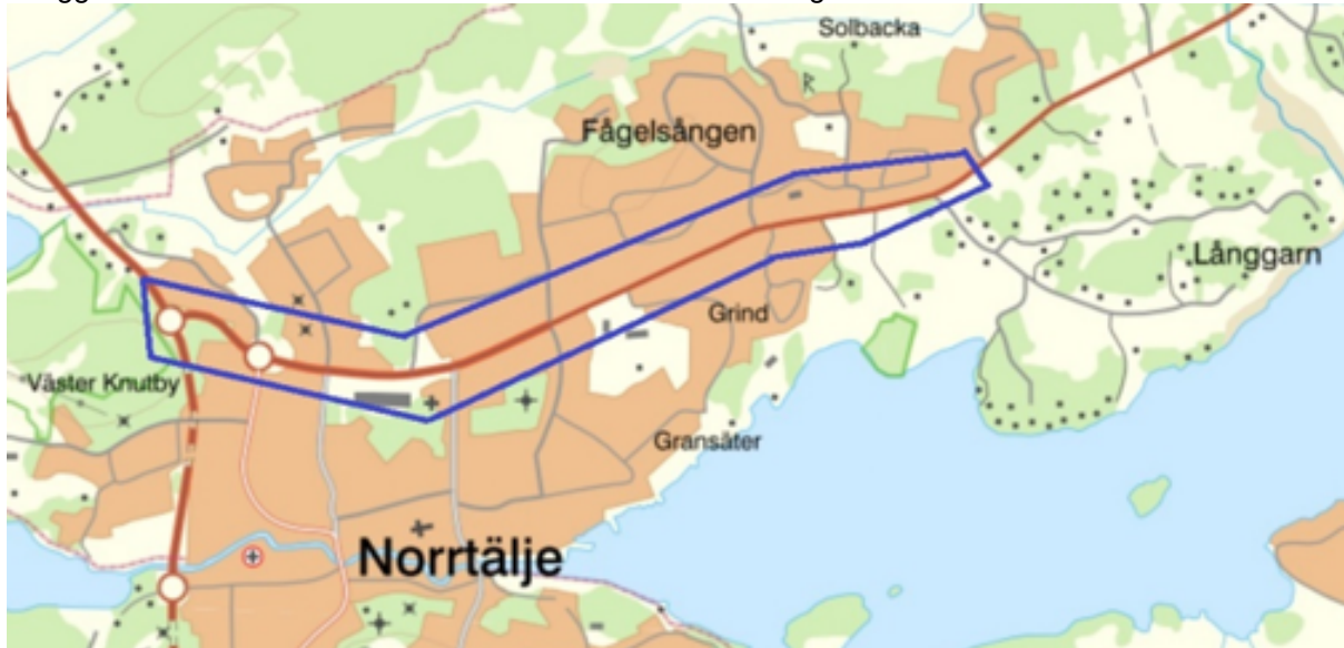
Figur 1 Visar markerat område som förstudien gäller

Förstudien är avgränsad enligt bild nedan, sträckan på Vätövägen mellan Västra vägen fram till Långgarn/Hårnacka som är den sträcka där kommunen är väghållare.