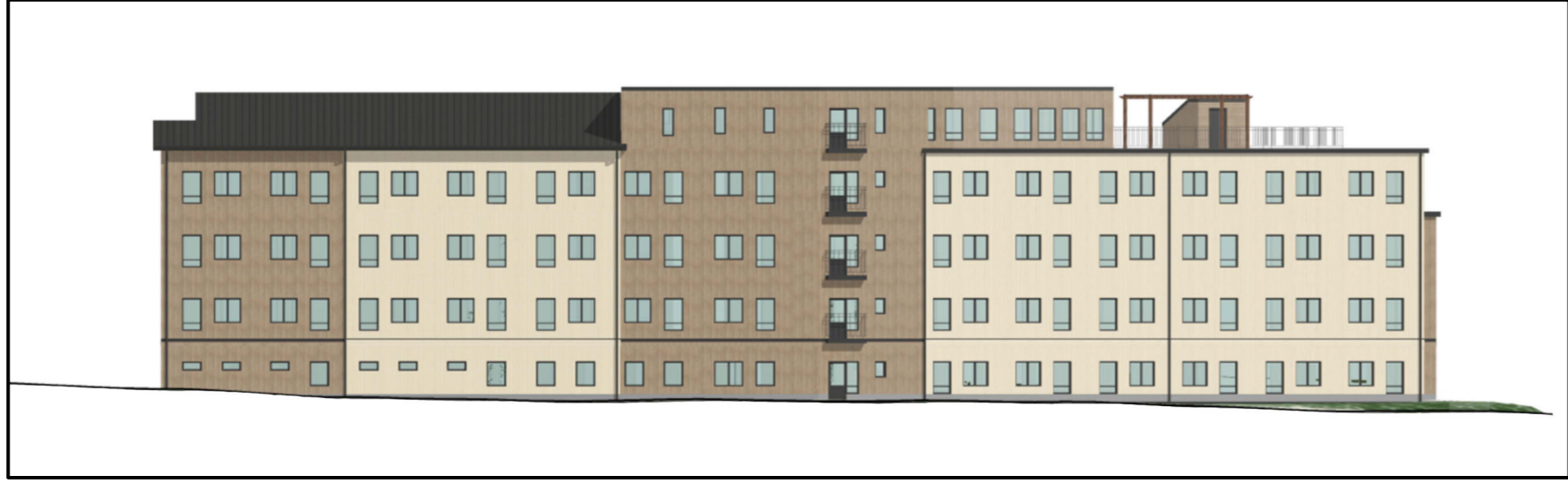
Illustration 1 - Principiell utformning och exempel på fasadindelning