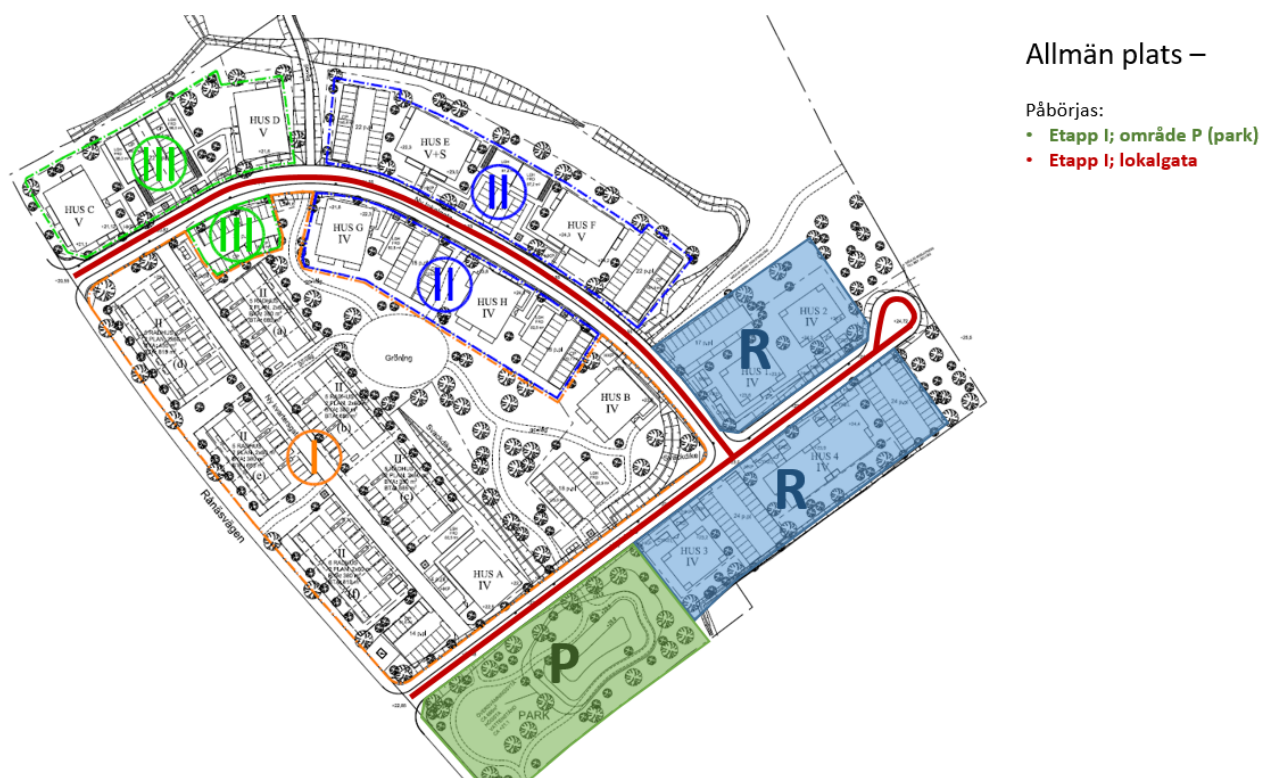
Bild 2. Kommunens åtaganden för parkanläggning med översvämningsyta illustreras ovan med grönmärkad yta P. Ingår i etapp I-II; park. Kommunens åtaganden för gatu- och gatuanläggningar illustreras ovan med rödmärkad linje. Ingår i etapp I-II; lokalgata.

*Driftskostnader för skyfallsanläggningen bedöms uppgå till 0 tkr/år då skötseln ingår i övrig parkskötsel med ansvar Gat- och parkavdelningen. Driftskostnaden delas i investeringen upp till hälften mellan Gat- och parkavdelningen och VA-avdelningen, 739 tkr/år respektive 692 tkr/år.