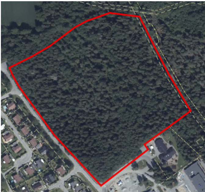
Bild 1. Rödmarkerad områdesgräns för Bålbroskogen, del av fastigheten Rimbo-Tomta 7:1.

Geografiskt omfattar investeringsärendet det markområde som omfattas av antagen detaljplan för Bålbroskogen, del av fastigheten Rimbo-Tomta 7:1 i Rimbo församling, som antogs av Kommunfullmäktige 2020-02-03. Området består i sitt ursprungsläge mestadels av skog, bild 1.