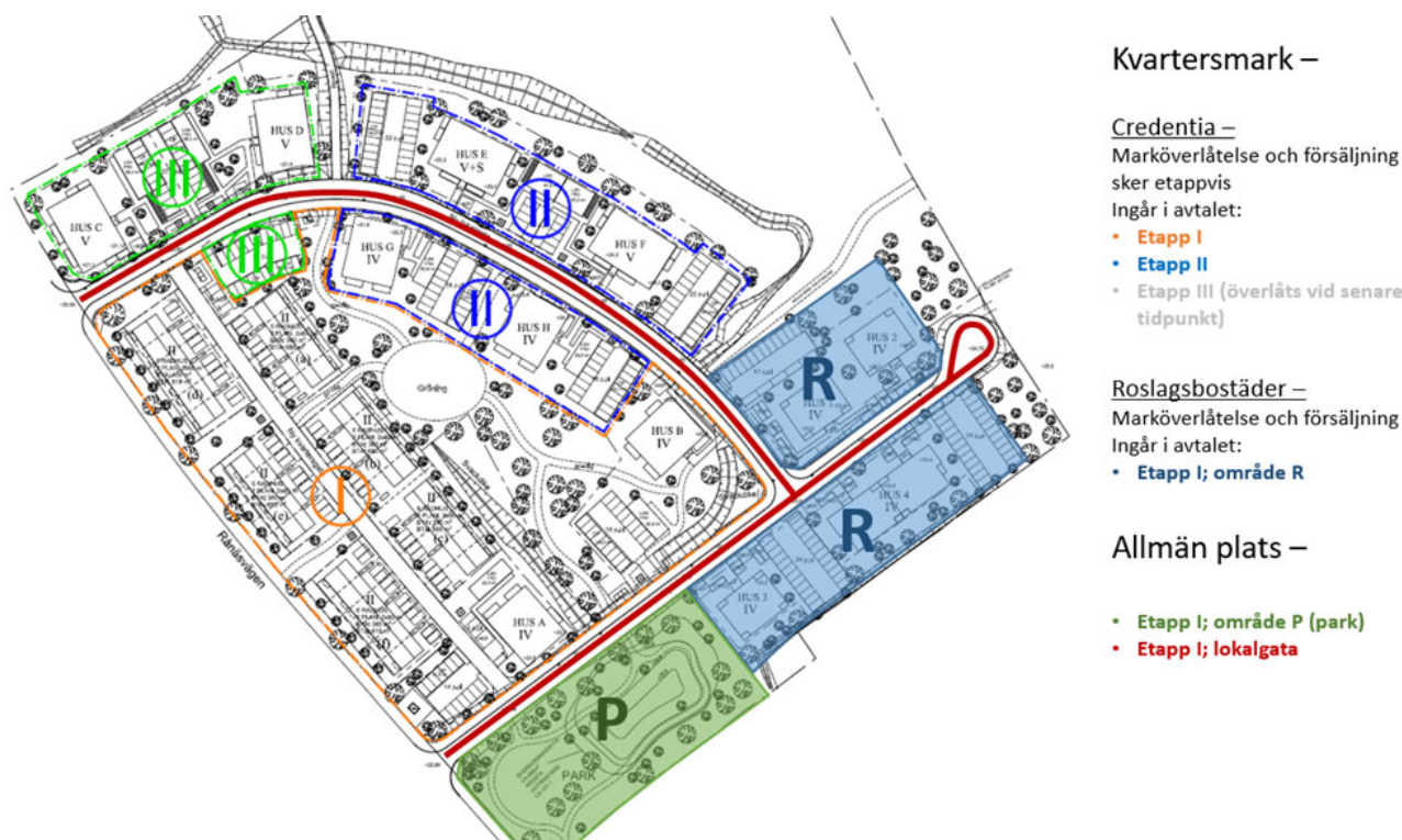
Bild 1. Schematisk bild över detaljplanens etapp- och bebyggelseindelning. Källa: Credentia AB / Norrtälje kommun.

Bostadsutbyggnaden inom området kommer ske etappvis i tre etapper, se bild 1. Kommunen kommer succesivt sälja av den kommunalt ägda marken inom respektive etapp och intäkterna för markförsäljningen kommer att komma stötvis, liksom intäkterna i form av exploateringsbidrag. Detta investeringsärende och kommunens åtaganden i samband med genomförandet av detaljplanen omfattar infrastrukturarbeten inom tidsramen för etapp I-II som försörjer samtliga etapper inom området.