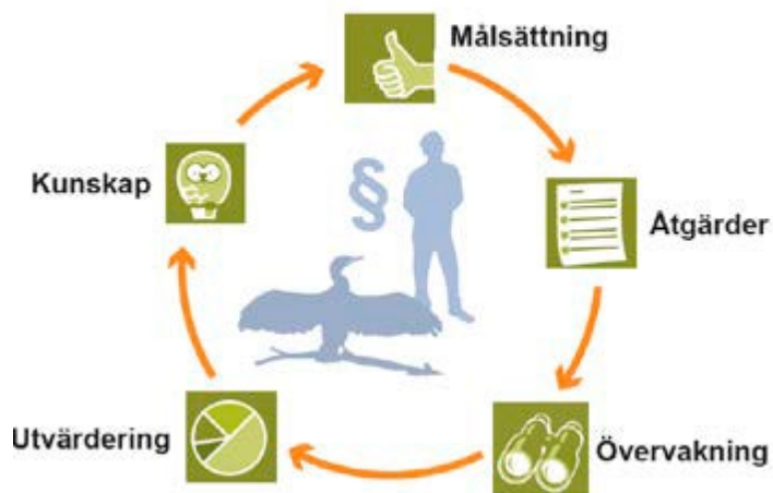
Figur 1. Schematisk bild över den adaptiva förvaltningen 1 .