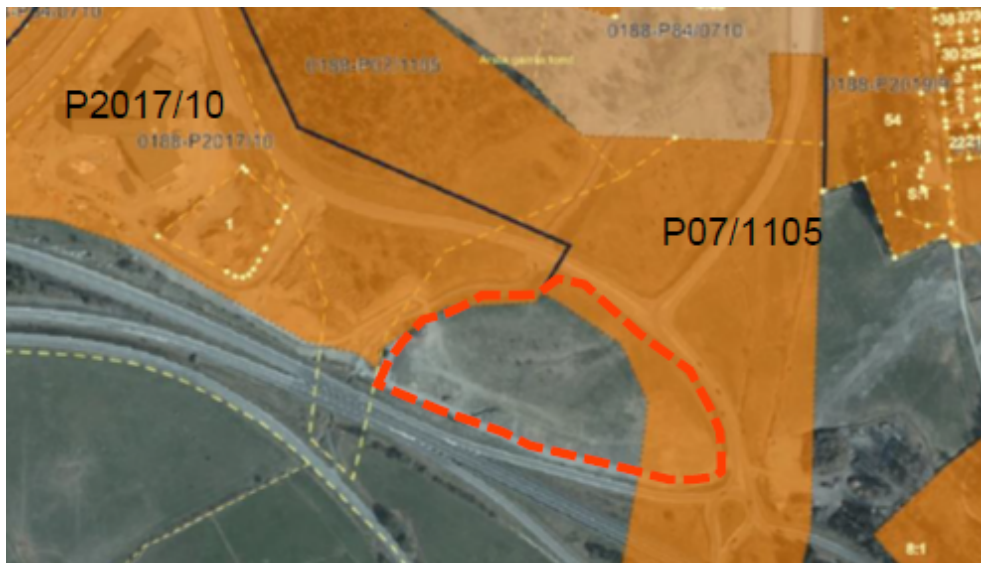
Planområdet inritat med streckad linje. Gällande detaljplaner fyllda i orange.

Planområdet är idag i huvudsak ej detaljplanelagt. I planområdets nordvästra gräns ligger Detaljplan för Görla 8:1 i Frötuna församling samt del av fastigheterna Tälje 4:45 och 4:62 i Norrtälje stad med genomförandetid till och med 2021-12-20 samt i planområdets nordöstra gräns Detaljplan för Väg 76, delen förbi Norrtälje med genomförandetid till och med 2022-12-05.