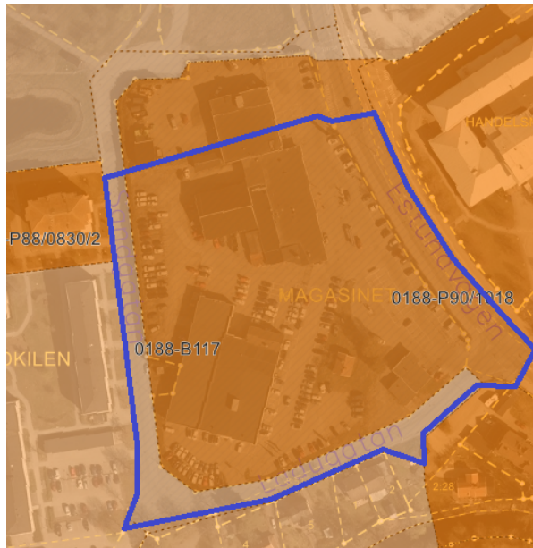
Planmosaik med planområdets gränser i blått.