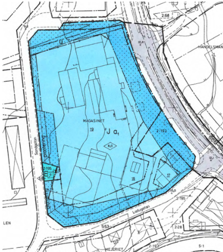
Urklipp ur Ändring av detaljplan för kv Magasinet samt del av Estunavägen.