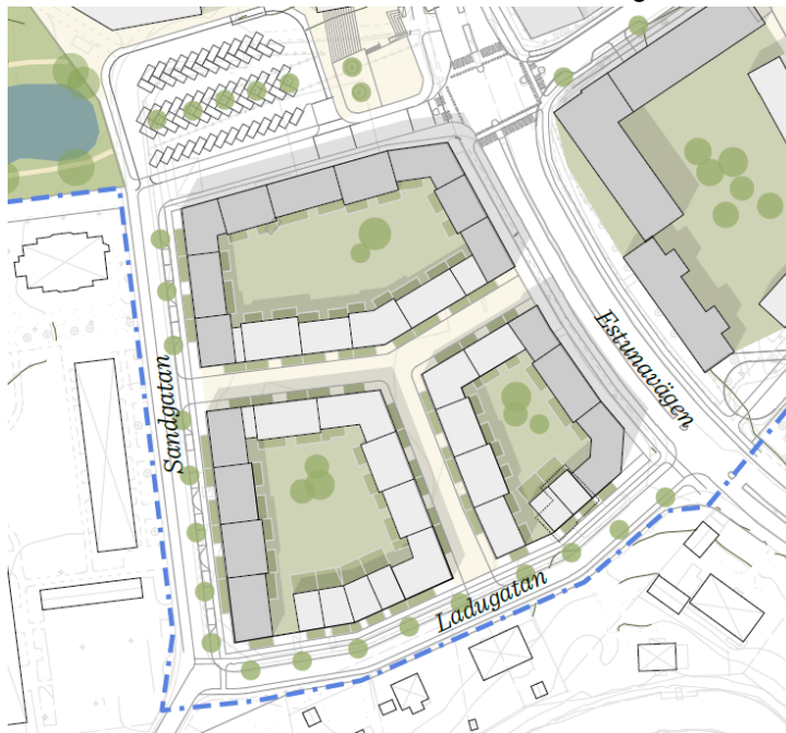
Urklipp ur Masterplan för Övre Bryggårdsgärdet

Arbetet med Övre Bryggårdsgärdet är ett omfattande stadsbyggnadsprojekt där verksamheter successivt omvandlas till en ny stadsdel med bostäder och centrumfunktioner. 2021-01-20 antogs i kommunens samhällsbyggnadsutskott ett kvalitets- och hållbarhetsprogram för Övre Bryggårdsgärdet som syftar till att konkretisera översiktsplanen och utvecklingsplanen för Norrtälje stad samt att beskriva och visualisera visionen och målsättningarna för området.