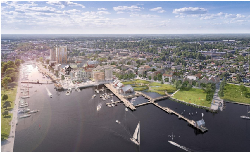
Visionsbild över Norrtälje Hamn (Bild: Sydväst arkitektur och landskap)

Det aktuella planområdet omfattar cirka 1 ha mark och är en del av projektet Norrtälje Hamn som syftar till att omvandla hamnen i Norrtälje från industriverksamheter till en ny, levande stadsdel med en blandning av bostäder, verksamheter och mötesplatser.