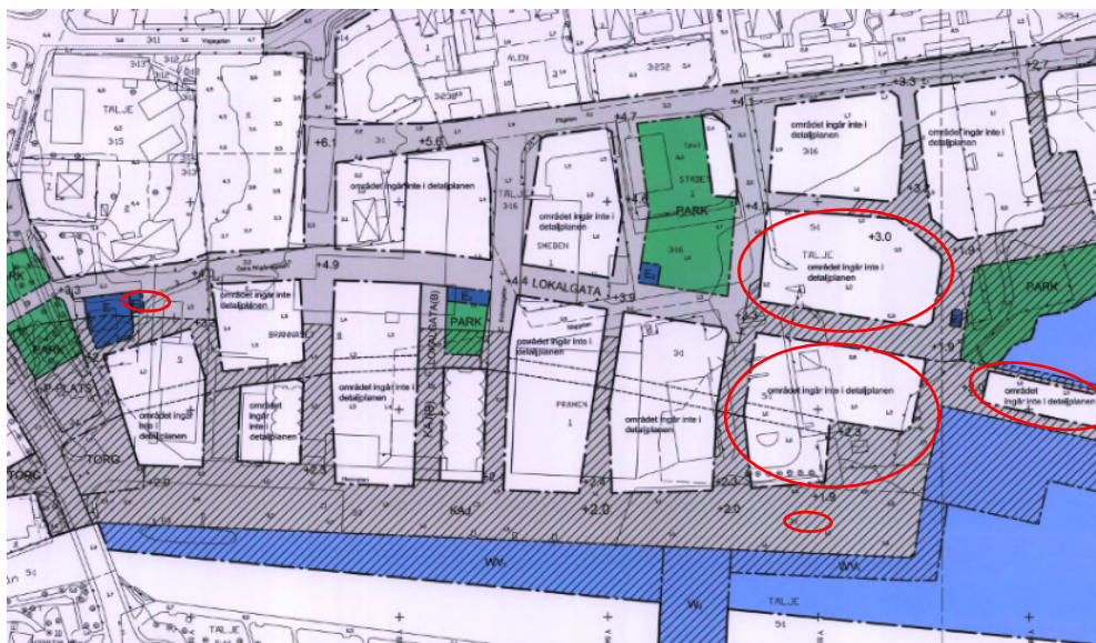
Gällande detaljplan med del av planområdet markerat med rött.

Detaljplan för del av Tälje 3:1 med flera, Norrtälje hamn - skelettplan, antagen av kommunfullmäktige 2014-04-14. Detaljplanen anger GATA .