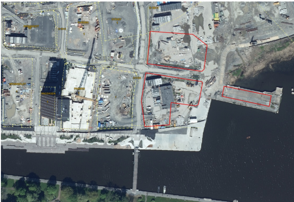
Ortofoto som visar befintlig markanvändning för huvuddelen av planområdet

Delar av planområdet (bostadskvarter och hotell) är lokaliserat i direkt anslutning till Hamnplan, som är tänkt att utgöra en viktig mötesplats för torghandel och året runt-aktiviteter. Detta blir entrén från vattnet när man kommer med båt i Norrtäljeviken. Detaljplaneområdet omfattar den yta där tidigare färjeterminal ligger. Denna byggnad planeras att rivas under 2023. Detaljplanen omfattar också den gamla piren som tidigare använts för färjetrafik. Denna är under renovering och är nu bland annat tänkt att husera en byggrätt för en allmän byggnad med flexibel användning. Intill piren planeras för ett stadsbad. Norra delen av planområdet (bostadskvarter) utgörs av en obebyggd yta som idag ingår i arbetsområde för projekt Norrtälje Hamn och delvis upplåts tillfälligt som etableringsyta för andra exploatörer i området.