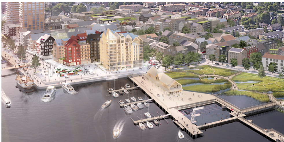
Utdrag från projekt och bebyggelseförslaget i markanvisningsavtalet för kv. Terminalen, Ankaret. Förslaget inkluderar även Hamnpiren, Roslagens Pärla AB

Kommunen bjöd den 6 maj 2021 in till en öppen markanvisningstävling för kvarter 9A och 9B invid Hamnplan i Norrtälje Hamn. Den 24 oktober 2022 godkändes markanvisningsavtalet mellan Roslagens Pärla AB och Norrtälje kommun avseende kvarter 9A, Terminalen och 9B Ankaret, i Norrtälje Hamn. Projekt- och bebyggelseförslaget omfattar även en byggnad på kvarteret Hamnpiren. Denna omfattas inte av markanvisningen utan planeras att upplåtas med nyttjanderätt, vilket kommer att avtalas separat. Kvarter 13 Färjan planeras att markanvisas parallellt med detaljplanarbetet och avtal om markanvisning bedöms vara klart senast innan granskning av detaljplanen.