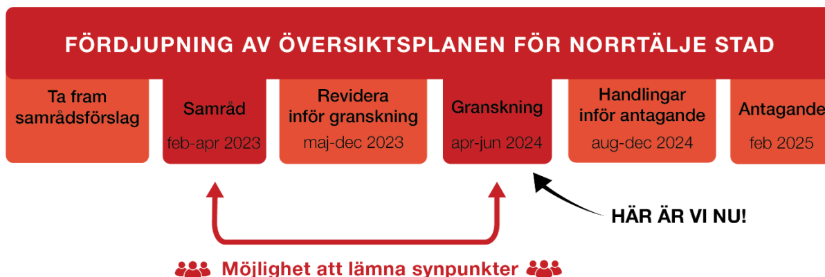
Figur 2 - Processen för arbetet med fördjupningen av översiktsplanen för Norrtälje stad

Granskning för FÖP Norrtälje stad planeras pågå mellan den 17 april – 17 juni 2024. Antagande beräknas ske i februari 2025, se Figur 2 nedan.