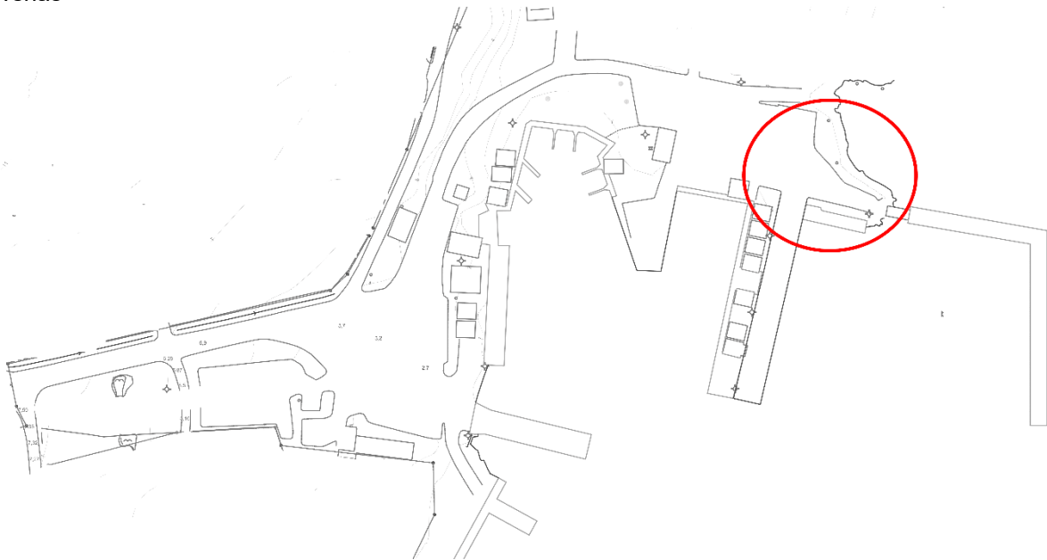
Arbetsområdet i Rävsnäs hamn