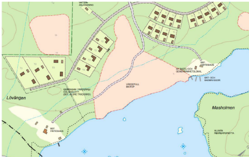
Figur 1: Illustrationsskiss tillhörande planbeskedsansökan.

Ansökan avser att möjliggöra bostadsbebyggelse inom del av fastigheten Harö 2:11. Den ursprungliga ansökan föreslog upp till 50 enbostadshus, men efter samråd med kommunen reviderades förslaget till en exploatering med cirka 20 enbostadshus. Tomtstorlekar föreslås variera mellan 1100 och 4500 kvadratmeter. Enligt förslaget föreslås att en eller flera gemensamhetsanläggningar bildas för vägar, grönområden, odlingsområden, vatten- och avloppsanläggningar, småbåtshamn och gemensamhetslokal.