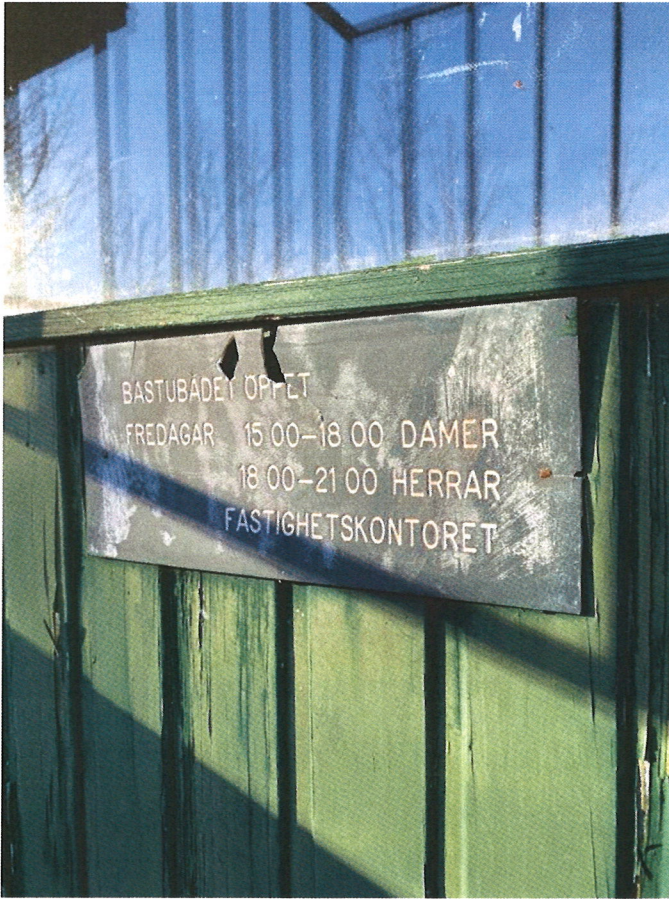
Bild från entrén till den gamla bybastun i Rö.