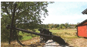
Singö hembygdsförening Backbyvägen 85