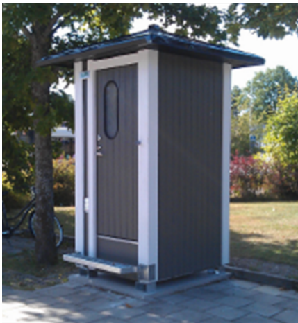
Befintliga dass i friluftslivet

även som en tillgänglighetsanpassad variant. På Largen badplats står ett av dessa nya dass och detta skulle vi istället placera ut i friluftslivet där vi inte ännu har denna uppdaterade version. Det tillgänglighetsanpassade dasset skulle fortsätta vara utan el och vatten så som i dagsläget—här återkommer vi till principen där vi gör skäliga anpassningar utan att påverka naturen mer än nödvändigt.