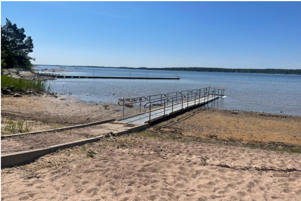
Tillgänglighetsramp på Marum

Largens badplats ligger placerad i södra zonen av Norrtälje kommun och utgör en av de mest populära badplatserna. Dess kristallklara långgrunda vatten gör detta till en väldigt barnvänlig badplats. Förutsättningarna för att anlägga en badramp ut i vattnet är väldigt goda på grund av den låga nivåskillnaden mellan sandstranden och botten. Mindre åtgärder krävs för att tillföra en stum yta på badplatsens grusade del ner till vattnet.