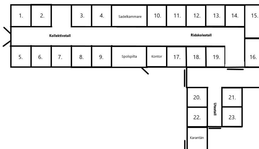
Figur 1. Ritningen är inte skalenlig utan visar enbart en översikt över staldelarna och boxnumreringen

Samtliga boxar, dörröppningar, stallgångar och takhöjder mättes under kontrollen.