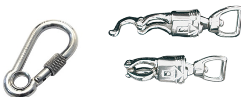
Karbinhake med lås Panikhake

Karbinhakar med lås och panikhakar kan godkännas under förutsättning att man ser till att stänga låset: