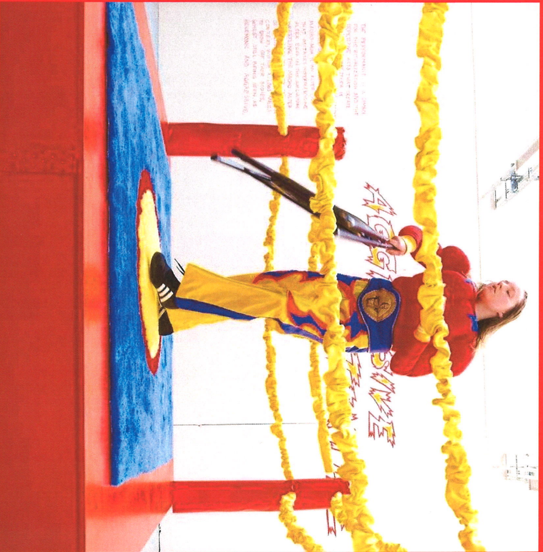
"AGGRESSIVE TEXTILE" 2022