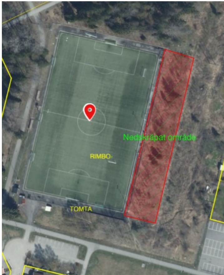
Bild 3 Nedskräpat område