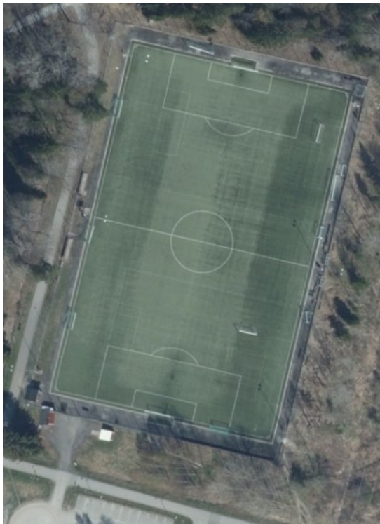
Bild 2 Mullevallens konstgräsplan