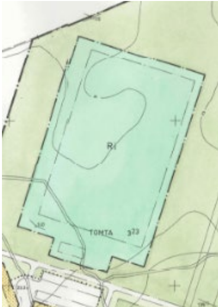
Bild 4 Detaljplan Mullevallen