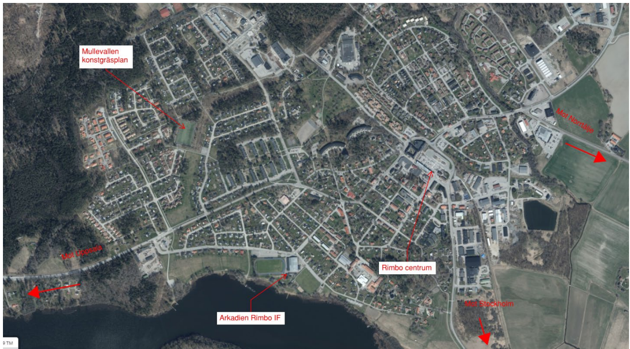
Bild 1 Översikt Rimbo

Mullevallen är en fullstor konstgräsplan med läktare, avbytarbås och liten kiosk. År 2023 lades nytt konstgräs på Mullevallen.