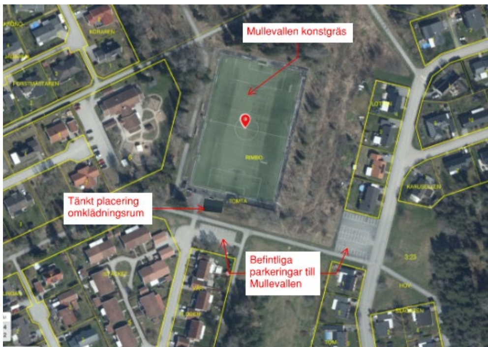
Bild 5 Översikt Mullevallen