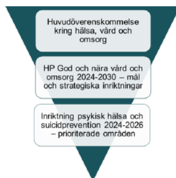
Bild 2. Kopplingen mellan Handlingsplan god och nära vård och omsorg (HÖK) och Inriktning för psykisk hälsa och suicidprevention.

Framtagen Stockholms läns 26 kommuner och region Stockholm, beskriver prioriterade områden inom psykisk hälsa och suicidprevention där stegförlyttningar förväntas göras. Inriktningen är en del av Handlingsplan för god och nära vård och omsorg i Stockholm län.