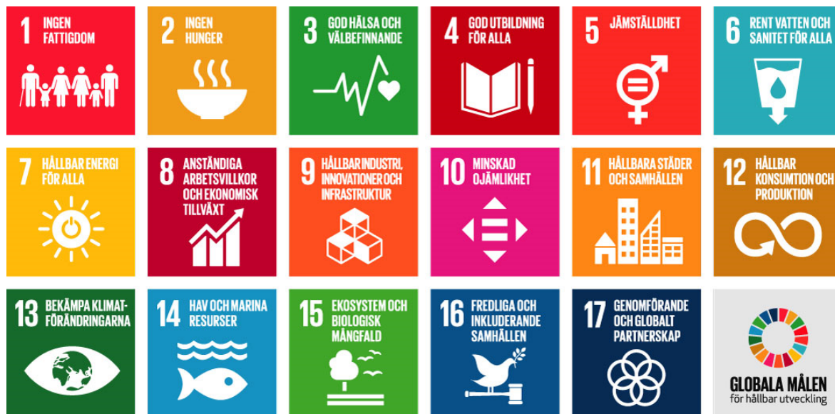
Figur 1. Agenda 2030, de globala målen för hållbar utveckling

Agendan innefattar 169 delmål, varav 93 är relevanta för kommunalt arbete, enligt en kartläggning gjord av SKR 2 . En hållbar utveckling är en utveckling som tillgodoser dagens behov utan att äventyra kommande generationers möjligheter att tillgodose sina behov. Och även om utmaningarna för en hållbar utveckling är globala, är lösningarna ofta lokala och kommunerna har stora möjligheter att påverka att de globala målen genomförs. För en hållbar utveckling av Norrtälje kommun behöver därför Agenda 2030:s mål och delmål genomsyra kommunens arbete vid planering, styrning och beslutsfattande i kommunfullmäktige, nämnder och styrelser.