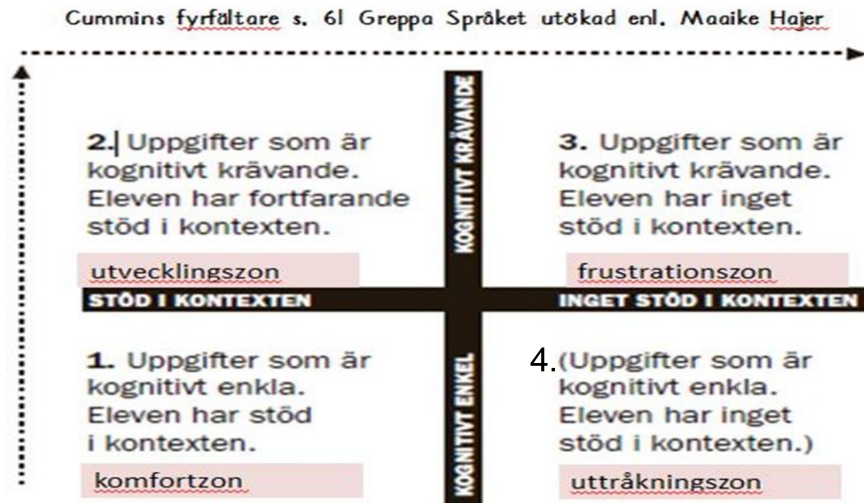
Figur 3. Modell över uppgifters språkliga krav (fritt efter Cummins 1996)